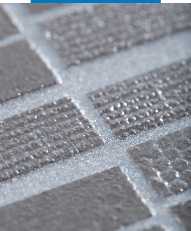
Kerapoxy Easy Design 700 mit Mapecolor Metallic shining Verfugung