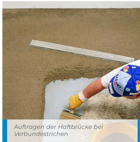
Auftragen der Haftbrücke bei Verbundestrichen