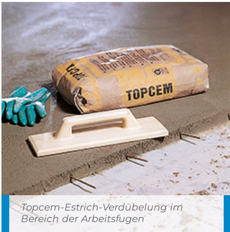
Topcem-Estrich-Verdübelung im Bereich der Arbeitsfugen